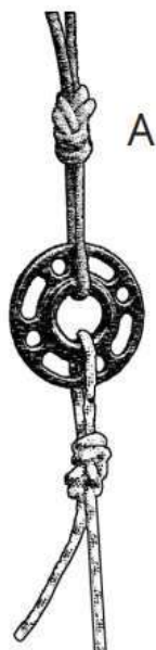
Figura 2. Estacionaria simple: Una sola cuerda anclada utilizando un nudo en ocho trazado en una instalación de cuerda estacionaria.