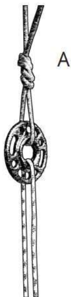
Figura 1. Móvil: Una sola cuerda que pasa a través del anclaje en una instalación de cuerda móvil.

La cuerda de respaldo del competidor debe estar conectada a la cuerda de respaldo del evento (Ver figura 2. El plato puede ser reemplazado por un anillo aprobado. (2024))